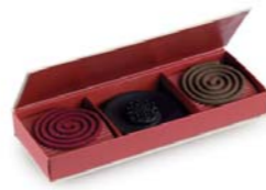
Coffret rigide avec compartiments séparés