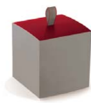
Étui avec fermeture languette fond et haut avec cale micro-cannelure