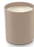
Verre cylindrique 210 g