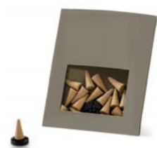
Etui simple avec sachet vinyle