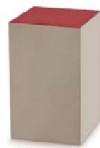
Pack avec cale micro-cannelure