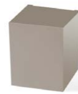
Pack ajusté avec calage